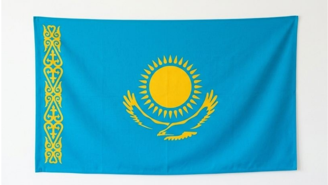
Bild: Flagge von Kasachstan

Auf dem Weg zum Weltjugendtag 2027 in Seoul: Impulse und Informationen aus der Deutschsprachigen Katholischen Gemeinde Korea