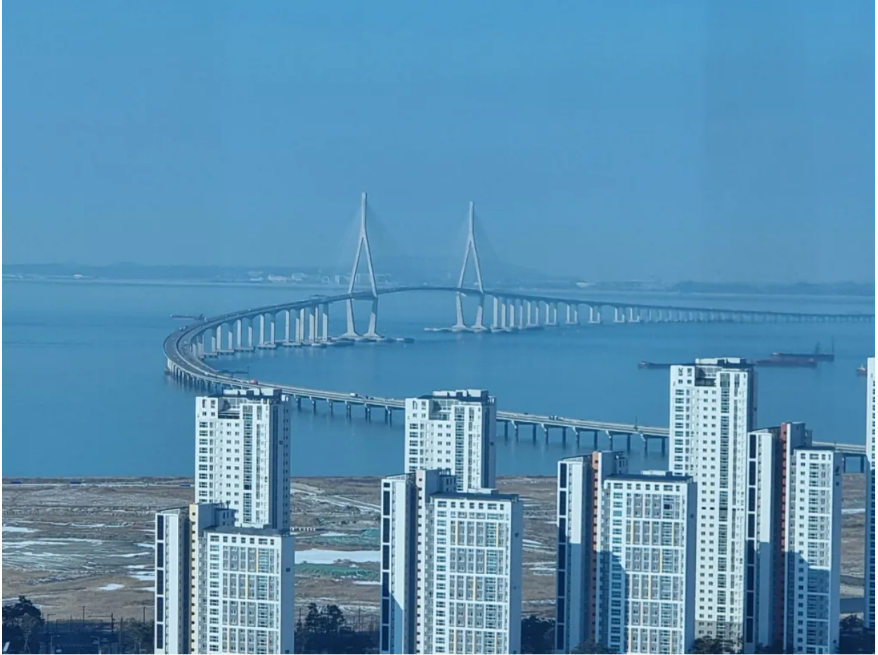
Foto: Verbindungsstraße zum größten Flughafen in Südkorea, Incheon, der auf einer Insel liegt

Auf dem Weg zum Weltjugendtag 2027 in Seoul: